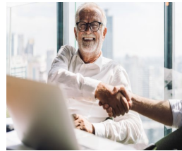
Beratung und Infos in der Pflege