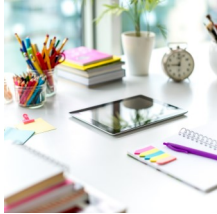
Termine und Veranstaltungen